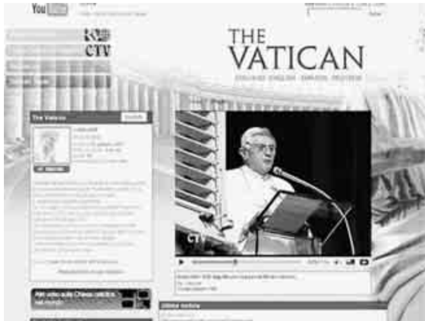
Il Vaticano su YouTube.

rituali. Troviamo qui una polarizzazione tra chi usa internet per questi scopi, e chi no. Analogamente, troviamo una polarizzazione a proposito delle reti sociali, come Facebook: il 43,9% vi accede almeno settimanalmente, mentre il 35,3% non le ha mai usate.